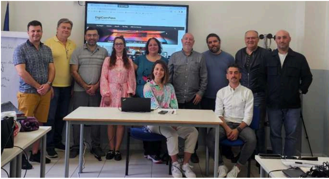
Συνάντηση εταιρών στο Τράνι (Ιταλία) Απρ. 2024 - Οργάνωση πιλοτικής δοκιμής.

Ο οργανισμός αυτός θα παρουσιαστεί εκτενέστερα κατά τη διάρκεια του επερχόμενου συνεδρίου που διοργανώνεται από το Πανεπιστήμιο Κύπρου , το οποίο είναι και συντονιστής του σχεδίου: