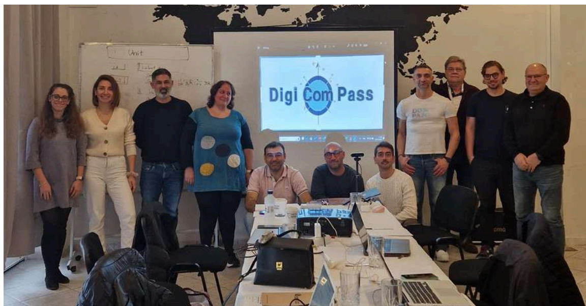
Συνάντηση εταίρων στην Καλαμάτα (Ελλάδα) Νο. 2023 – Εκπαίδευση Δημιουργίας Πολυμέσων

Η νεοσύστατη κοινοπραξία αναπτύσσει ένα εκπαιδευτικό πρόγραμμα και μια πιστοποίηση για ψηφιακές δεξιότητες χρησιμοποιώντας την προσέγγιση Flipped Learning 3.0. Το πρόγραμμα σπουδών έχει σχεδιαστεί για διάφορες ομάδες-στόχους, συμπεριλαμβανομένων ενηλίκων, ανέργων νέων, φοιτητών, μαθητών με ειδικές εκπαιδευτικές ανάγκες και μεταναστών. Ο στόχος είναι να αναπτυχθεί ένα εκπαιδευτικό υλικό που να μπορεί να προσαρμοστεί σε πολλαπλές ομάδες-στόχους, ενώ παράλληλα να είναι ολοκληρωμένο και προσιτό, λαμβάνοντας υπόψη την πολυμορφία του κοινού.